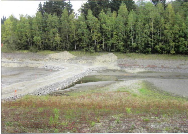
Abb. 3: Durch den Bau einer Behelfsstraße im Zuge der Sanierungsarbeiten im Bereich der Pfaunteiche und des Werks Tanne wurde der historische Teichdamm tangiert, aber gemäß Auflagen der Denkmalbehörden wieder in den Ursprungszustand zurückversetzt