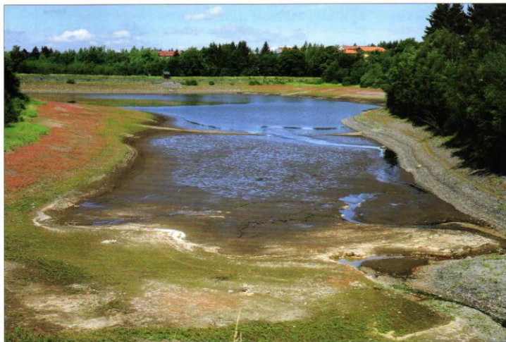
Abb. 2: Bei Niedrigwasser sind die Dammreste eines historischen Teichs im Unteren Pfaunteich zu erkennen – nach derzeitigem Stand des Wissens war es der Banediek

Der Teich wird in der Literatur teilweise als Fischteich des Klosters Cella interpretiert, könnte aber auch mit dem hier 1251 erwähnten Bergwerk Horbeck oder der Hütte to der Tzelle zusammenhängen 4 . Im Gegensatz zu vielen unsinnigen Angaben im Internet lässt sich dieser im Oberlauf der Burgstätte gelegene Teich mit dem Kloster Walkenried jedoch nicht in Zusammenhang bringen – es gibt nicht den geringsten Nachweis für einen „im 12. oder 13. Jahrhundert“ von diesem Kloster im Oberharz angelegten Teich – übrigens auch später nicht!